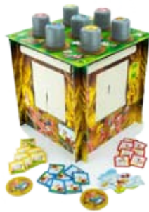
Worm Party 37

frisch gespielt bewertet die mehrfach Test-gespielten, hier vorgestellten Spiele nach folgender Methode: