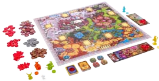
Zauberlehrling gesucht 31

39 Wir stellen vor: Das völlig unkomplizierte Abo